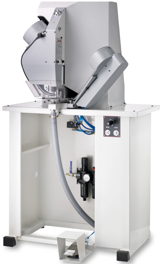
Pneumatischer Vollautomat Pneumatic eyeletting machine