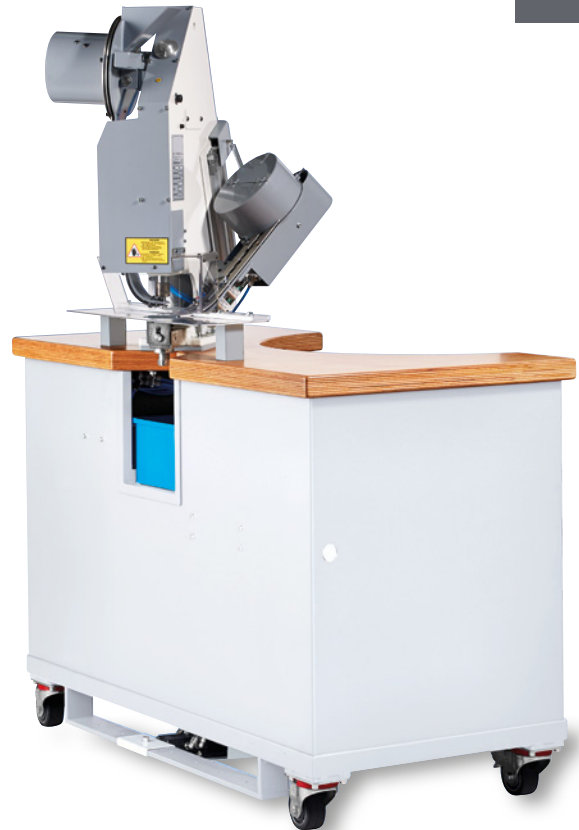
Pneumatischer Vollautomat Pneumatic eyeletting machine